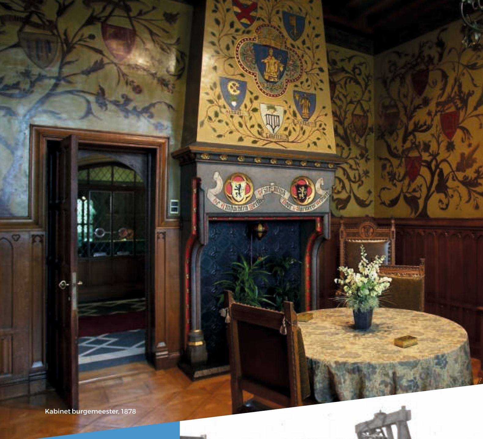
Kabinet burgemeester, 1878