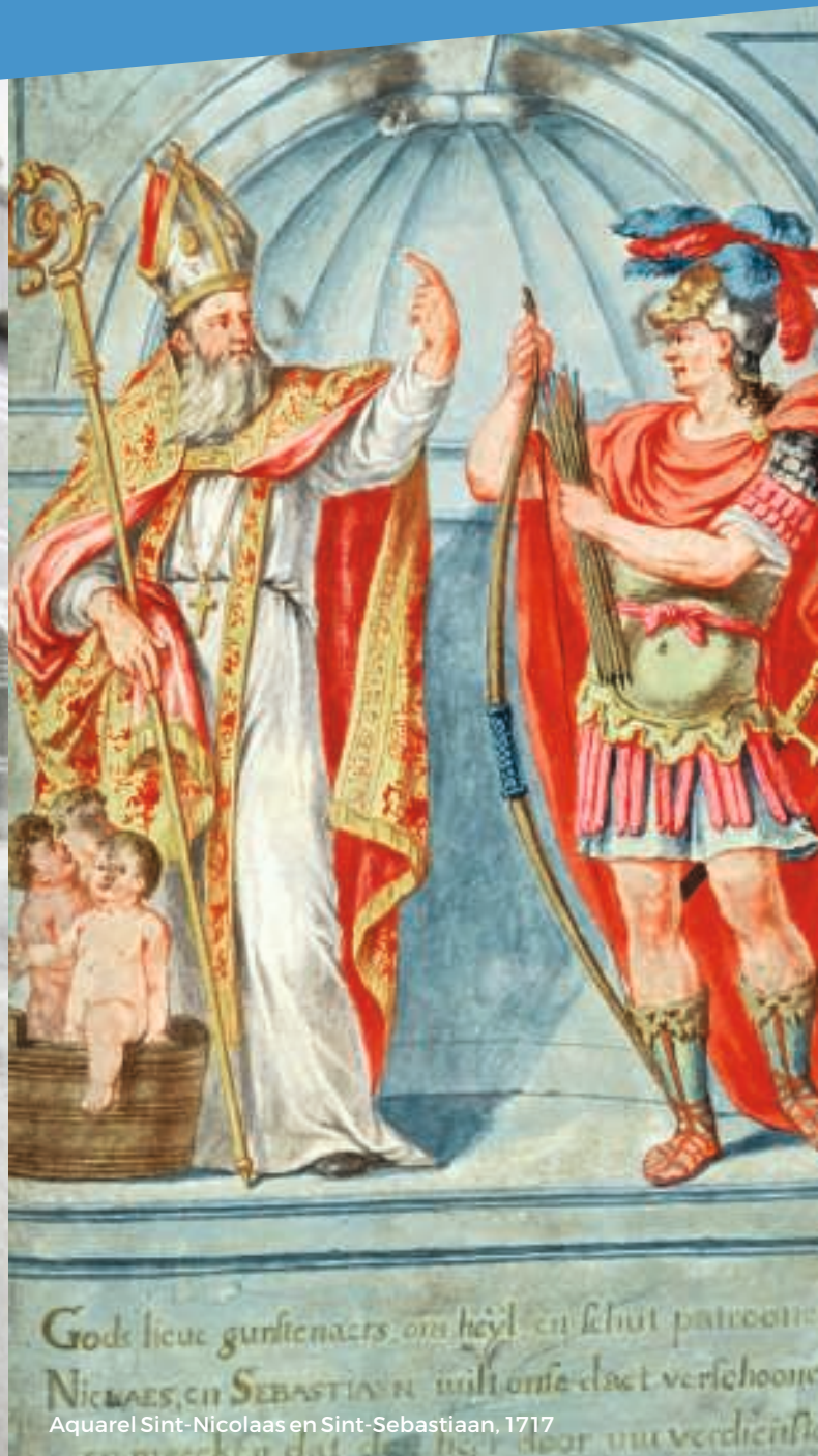
Aquarel Sint-Nicolaas en Sint-Sebastiaan, 1717

26-08 > 19-11 Zijde gij ook van Sinnekloas