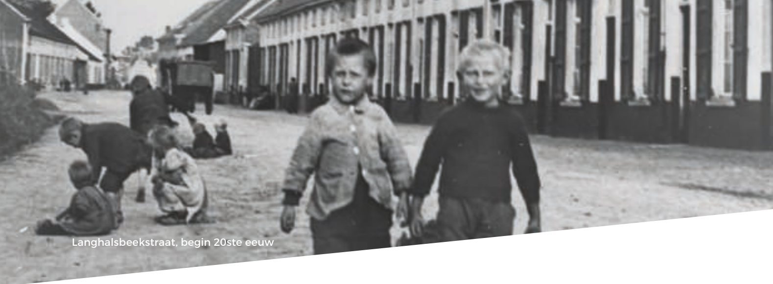
Langhalsbeekstraat, begin 20ste eeuw