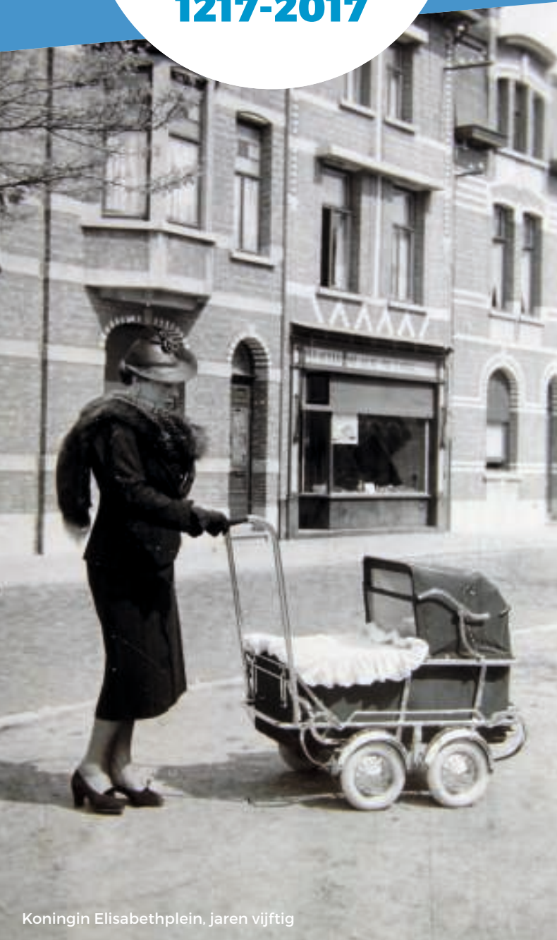
Koningin Elisabethplein, jaren vijftig